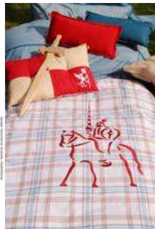
Billes et Marelle