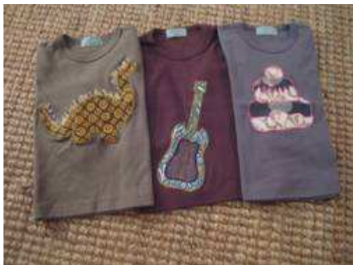
Marmelade en Balade

Le salon professionnel dédié à l'enfant et à la futur maman qui aura lieu à Paris les 21, 22 et 23 juin, accueillera trois marques soutenues par le Village des Créateurs : Marmelade en Balade, prêt-à-porter et accessoires enfants et Liebe, vêtements pour femmes enceintes et Billes et Marelle, linge de maison pour enfants.